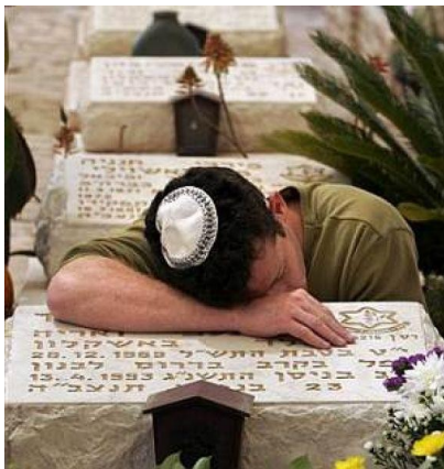
знанных потерями АОИ.